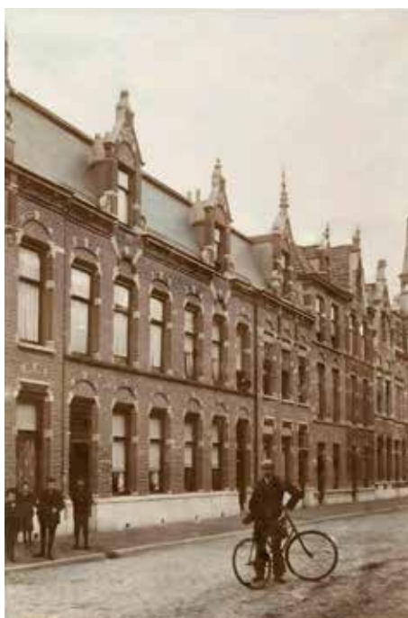
Van Blankenburgstraat 11

De collectie van Scheurleer vormt de basis van de muziekcultuur van het Kunstmuseum, dat komend jaar na een flinke onderbreking de instrumenten weer ten toon zal stellen.