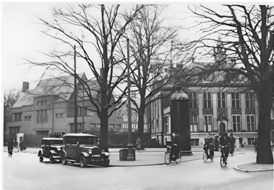
Woonhuis en museum Carnegielaan