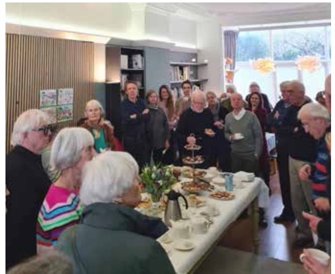
Feestelijke high tea