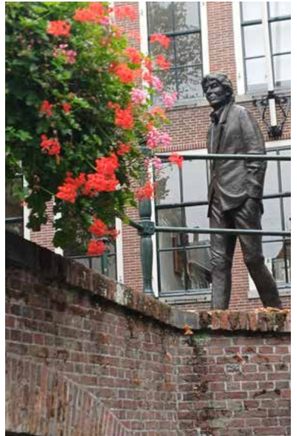
Paul van Vliet op de Maliebrug