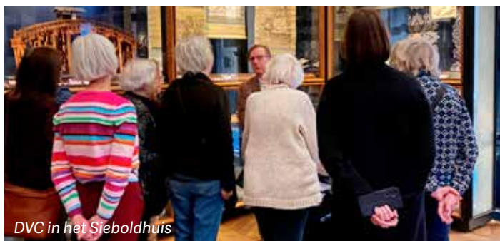
DVC in het Sieboldhuis

Op donderdag 15 januari bezochten we het Sieboldhuis in Leiden, waarin het Japanmuseum is gevestigd; een gids leidde ons rond langs de vaste collectie en vertelde over Japans lakwerk en keramiek, over het leven op Deshima, geisha's en samurai. Meerderen van ons hadden ter voorbereiding op het bezoek het boek van Annejet van der Zijl gelezen over het leven van Frans van Siebold en zijn dochter. In 1883 arriveerde Siebold op Deshima, de Nederlandse