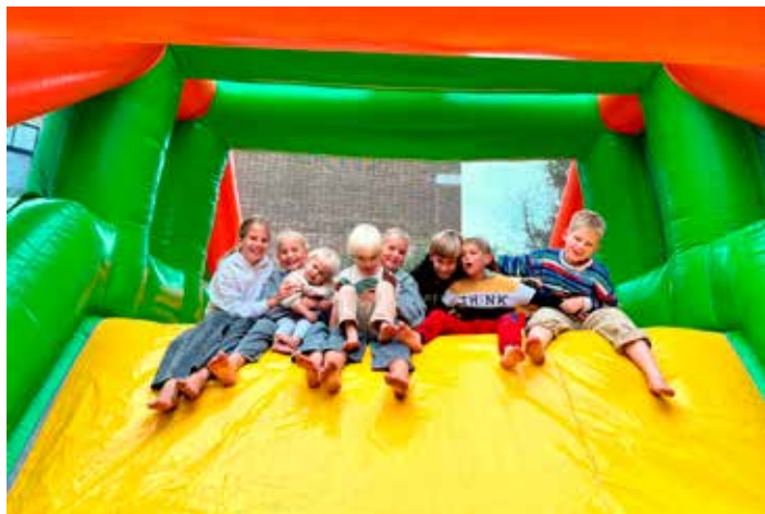
Straatfeest Obrechtstraat, 2025

Vieren jullie al Burendag in de straat? Wist je dat je tot € 350,- subsidie kunt aanvragen om een activiteit te organiseren? We roepen Duinoorders op om in hun straat Burendag te vieren. Lees hoe ze het aanpakten in de Tasmanstraat, laat je inspireren en begin op tijd. Het is makkelijker dan je denkt!