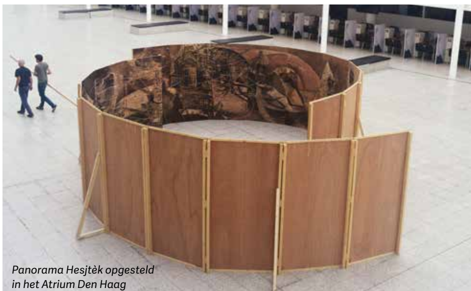
Panorama Hesjtèk opgesteld in het Atrium Den Haag